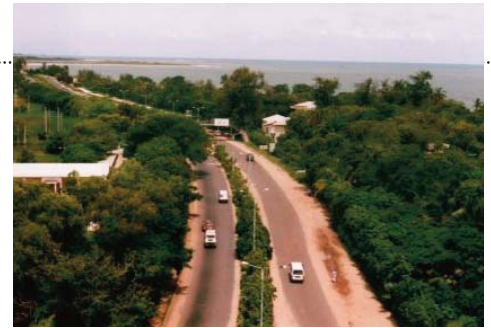
L'Autoroute Transafricain sur la Côte Ouest

Pour lui, la nécessité de choisir un champion parmi les