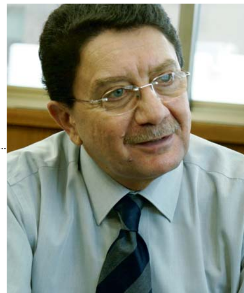
Taleb Rifai, Secrétaire-Général de l'Organisation Mondiale du Tourisme

Le développement du tourisme, s'il n'est pas correctement planifié et géré, risque de détruire les ressources naturelles dont elle dépend pour son succès. Cela est particulièrement le cas pour les PEID, où le