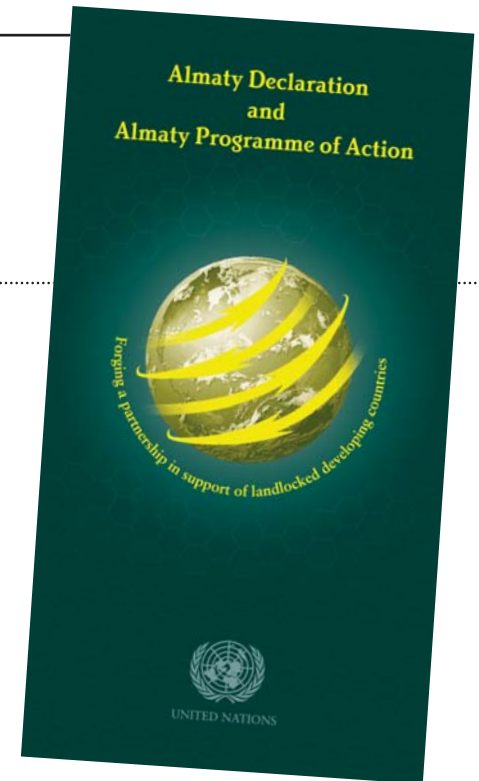
La Déclaration d'Almaty La couverture du Programme d'Action d'Almaty