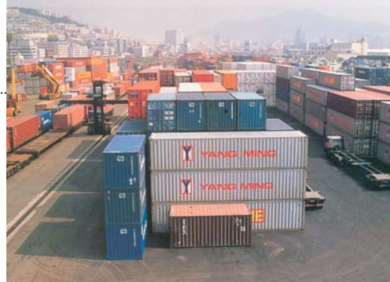
Les conteneurs d'expédition attendent le départ

Il attire également l'attention sur le fait que des projets propres aux pays en développement sans littoral et leurs efforts pour faciliter plus généralement leur commerce transfrontalier ont figuré en bonne place dans les études de cas. Au cours du troisième examen mondial de l'Aide pour le commerce, accompli en juillet 2011, 96 des 275 études de cas présentées – soit plus d'un tiers – portaient expressément sur les pays en développement sans littoral ou avaient été soumises par ces pays eux-mêmes, sans parler du grand nombre d'études de cas qui concernaient les moyens propres à faciliter le commerce englobant les pays en développement sans littoral parmi les bénéficiaires. Il encourage les pays en développement sans littoral à se préoccuper plus activement de présenter leurs propres études de cas.