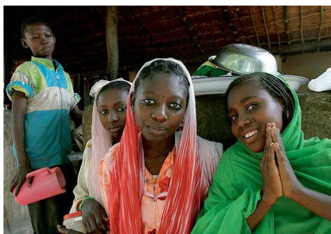
Les étudiants d'UNICEF

Les discussions ont également relevé des facteurs non académiques qui affectent l'inscription, l'assiduité