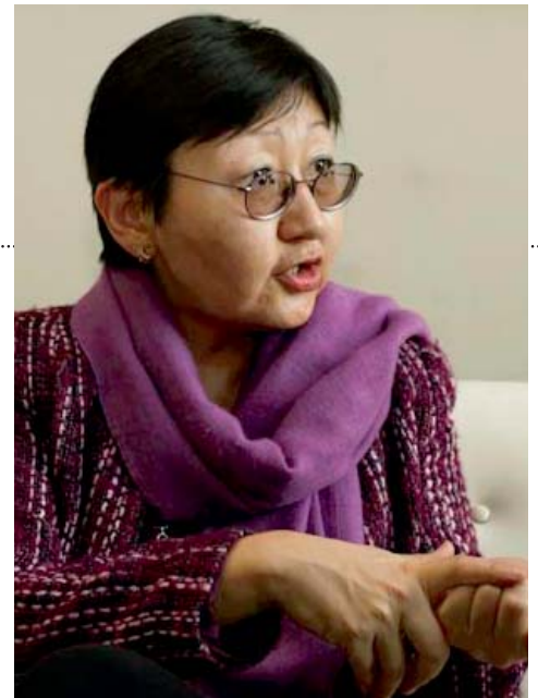
Ambassadeur et Représentant Permanent de la Mongolie auprès des Nations Unies

L'objectif final est d'accompagner les efforts des pays en développement sans littoral afin de les aider à atteindre les objectifs du millénaire pour le développement d'ici 2015, mais aussi à améliorer le développement humain, la santé maternelle et à réduire la mortalité infantile ainsi que les problèmes de santé.