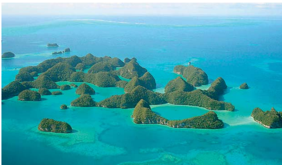
L'île de Palau

Beaucoup de petits états insulaires en développement ont valorisé l'appui communautaire dans la conservation la diversité biologique et l'identification